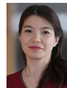
Мисс Сания Ассистент преподавателя Nursery